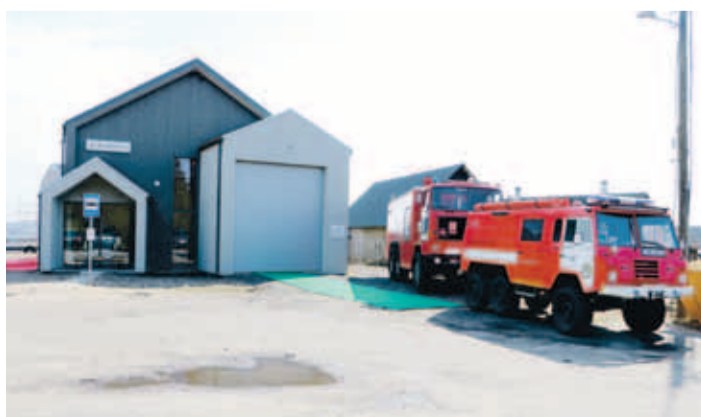
Vastvalminud Kaberneeme vabatahtliku päästekomando depoohoone, arhitekt Ralf Tamm, Realarhitektid OÜ.