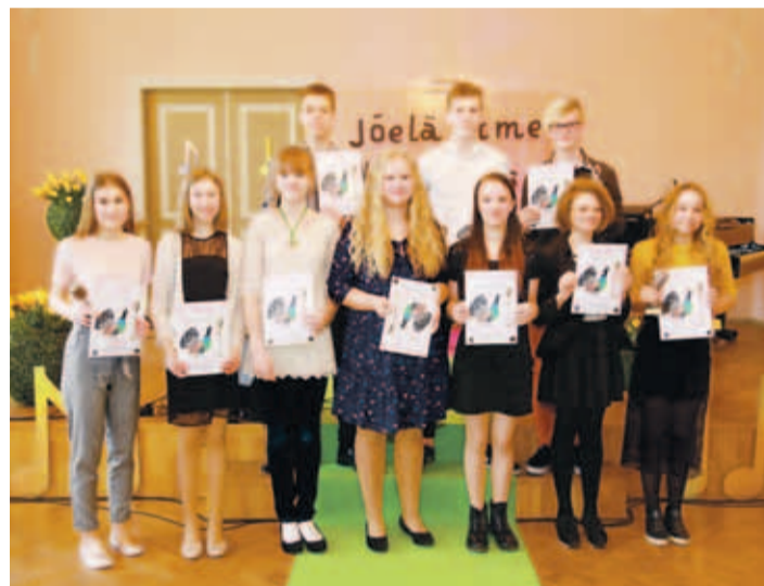
13–15- ja 16–18-aastased noored lauljad.