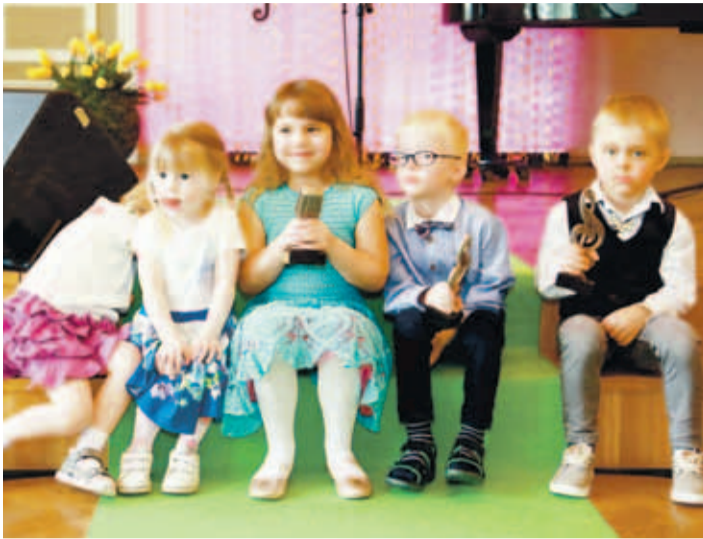
3–4- ja 5–6-aastased laululapsed.