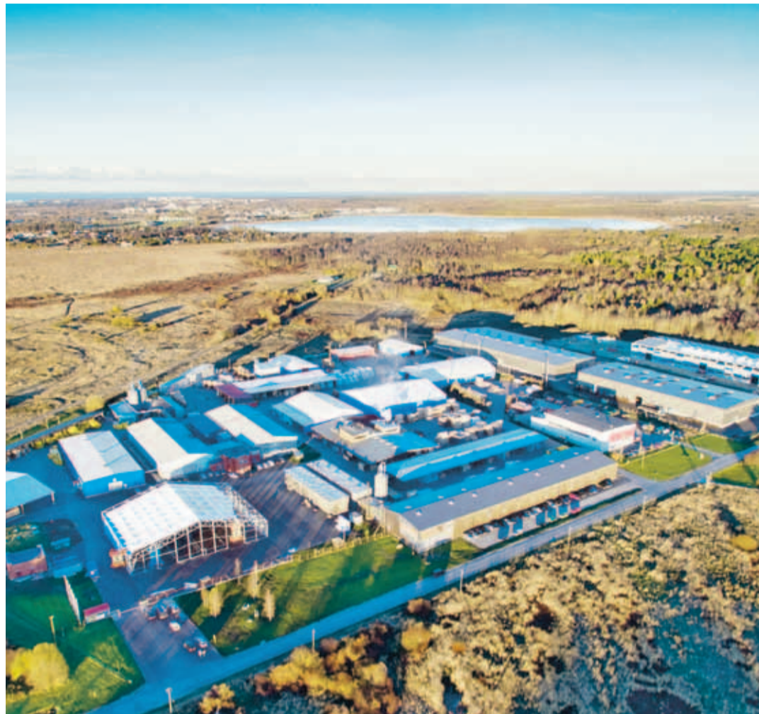
Thermory AS tootmiskompleks Lool.

Thermory Loo tootmiskompleksis toimub pidev täiustamine, perioodil 2010–2016 on investeringud tootmisesse