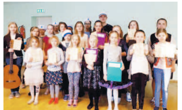
Jõelähtme MKK muusikaosakonna lapsed omaloomingupäeval Loo kultuurikeskuses.